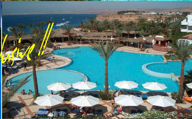
IBEROTEL FANARA *****